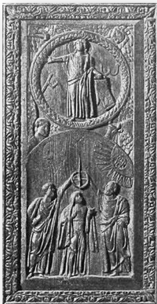
Вознесение Господне. V в. Деталь резных дверей церкви Санта Сабина в Риме

Со временем изображения Вознесения стали все больше быть похожими на современные и привычные нам иконы этого праздника. В качестве примера можно привести рельеф на деревянных дверях базилики святой Сабрины в Риме. Он тоже V века, но изображенная на нем композиция очень похожа на привычные нам иконы и картины. Доска условно разделена на два пространства. Внизу стоит Богородица в окружении апостолов Петра и Павла, которые держат над Ней царский венец. Верхняя часть – Небо. В центре него стоит Спаситель, на фоне четырех крылатых животных, символизирующих четырех евангелистов. Рядом с изображением Христа мы видим греческие литеры «альфа» и «омега», что является отсылкой к Апокалипсису, где Он Сам о Себе говорит: «Я есмь Альфа и Омега, начало и конец, Первый и Последний» (Откр. 22: 13). Примечательно, что на этой иконе Господь