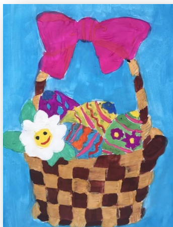
Рисовали Дарья Кабыш